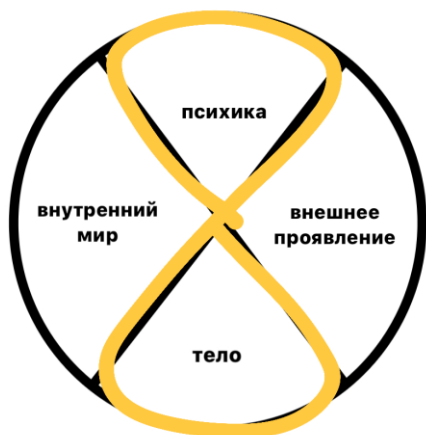
1.2. Компоненты структуры личности.