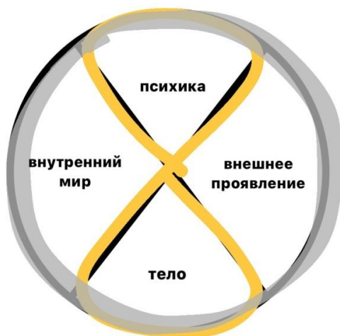
1.3. Компоненты структуры личности.